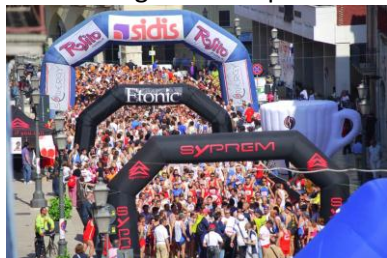
Partenzo 10 maggio 2009

Immagini nostre precedenti manifestazioni: