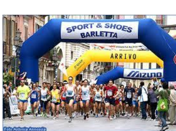
Partenza 22 maggio 2011