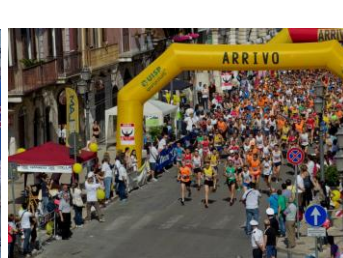
Partenza 13 maggio 2012