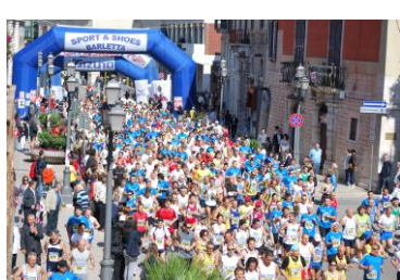
Partenza 9 maggio 2010